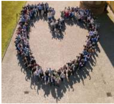
100 Gute Taten Mit 100 Guten Taten geben wir Einblick in unsere tägliche Arbeit: Förderung und Inspiration.