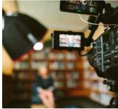
Zeitzeugen-Interviews Mitarbeitende, Aufsichtsrat und Bank-Vertreter erinnern sich an Wissenswertes und Kurioses.