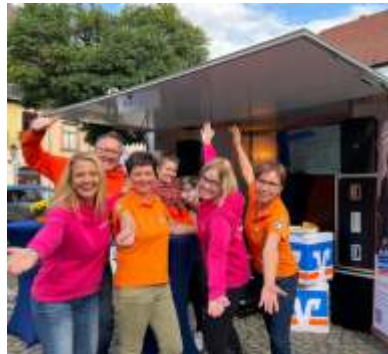
Jubiläumstour In 10 Wochen Jubiläumstour feiern wir mit > 4.000 Mitgliedern inkl. Angeboten und Geschenken.