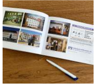
Chronik und Chronikfilm Unsere neue Chronik erscheint im Frühjahr 2024. Der Chronikfilm ist bereits online zu finden.