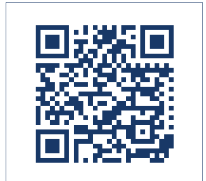
Gewinnspiel für Sie Schnell mitmachen! Wir verlosen 5 x 2 100-Jahre-Tassen, 8 adidas-Rucksäcke und 5 Bienen-Inseln.