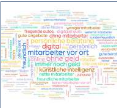
Ergebnisse Kundenumfrage Annahmen und Wünsche unserer Kunden für ihre Bank in 50 Jahren lagern wir im Tresor ein.