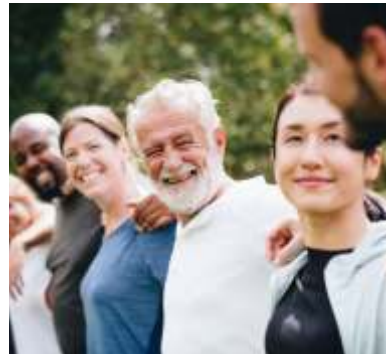
#MöglichMachen Die Aktion #MöglichMachen vergibt 100.000 Euro unserer Bürgerstiftung für Gemeinnütziges.