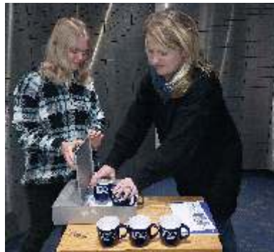
Erinnerungen für die Zukunft Kindertags-Mal-Bilder, Chronik, Jubiläums-Tassen sowie Fotos kommen mit in den Tresor.