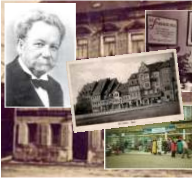
Historische Fotos Mit historischen Fotos blicken wir zurück auf 100 Jahre erfolgreiche Bank-Geschichte.